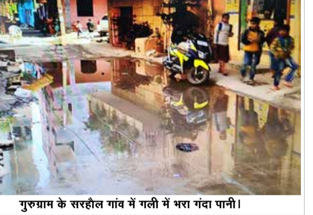
गुरुग्राम के सरहोल गांव में गली में भरा गंदा पानी।