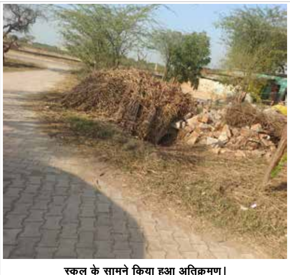
स्कूल के सामने किया हुआ अतिक्रमण।