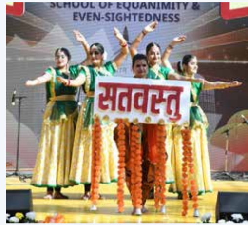
गुरुग्राम टुडे/भगवत दयाल

सतयुग दर्शन ट्रस्ट के मानवता संदेश की श्रृंखला के साथ जुड़ने में लगी है होड़