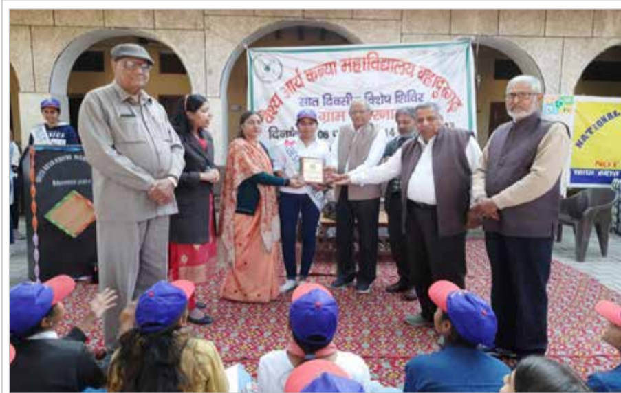
कैम्प समापन पर स्वयंसेविका स्मृति चिन्ह भेंटकर सम्मानित करते हुए मुख्यातिथि व अन्य अतिथि।