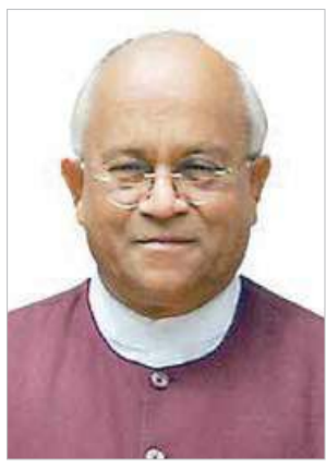
डॉ. वेदप्रताप वैदिक