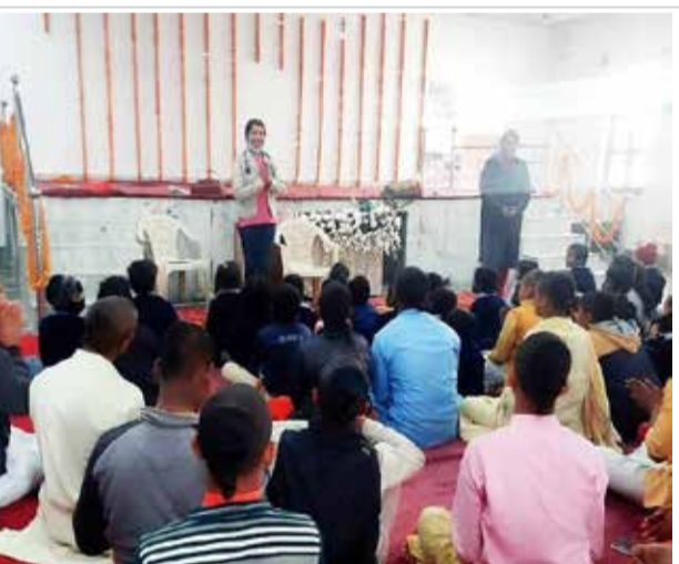
आयुष विभाग द्वारा अंतरराष्ट्रीय बाल कैंसर दिवस पर आयुष चिकित्सा शिविर में बच्चों को जागरूक करती चिकित्सक।