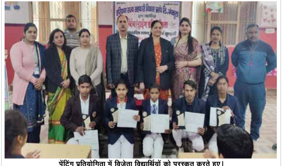
पेंटिंग प्रतियोगिता में विजेता विद्यार्थियों को पुरस्कृत करते हुए।